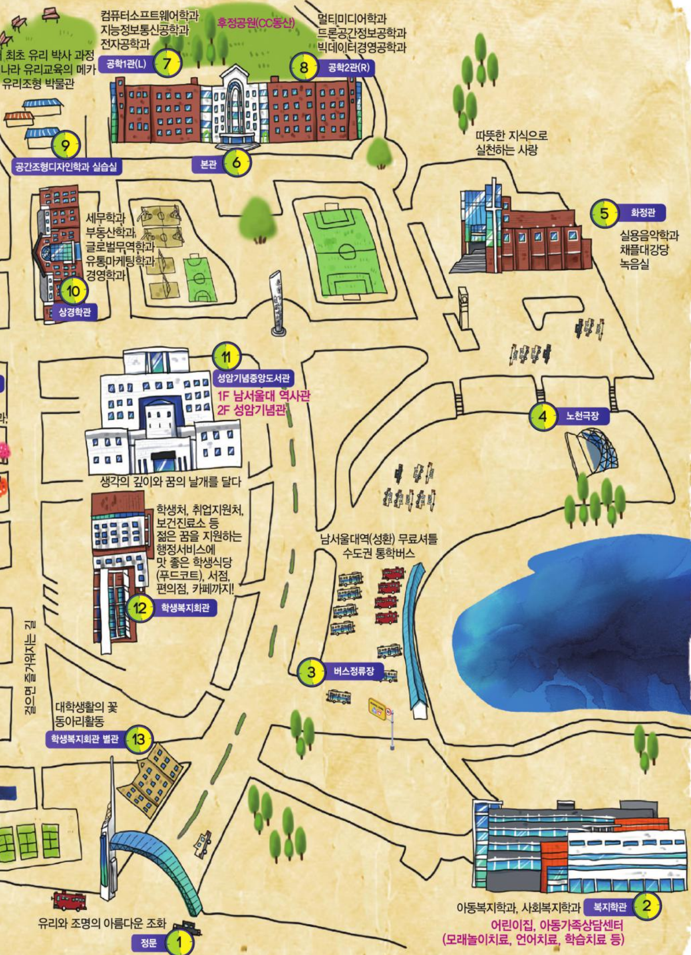
NAMSEOUL UNIVERSITY CAMPUS GUIDE MAP