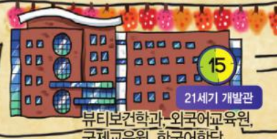
15 21세기 개발관 뷰티보건학과, 외국어교육원, 국제교육원, 한국어학당, 관광경영학과, 호텔경영학과