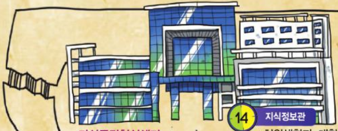
14 지식정보관 치위생학과, 대학원 산학협력단, 창업교육센터, 카페