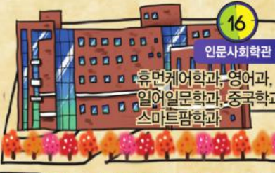
16 인문사회학관 휴먼케어학과, 영어과, 일어일문학과, 중국학과, 스마트팜학과