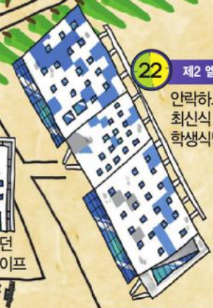
22 제2 엘림생활관 안락하고 쾌적한 최신식 호텔형 기숙사 학생식당