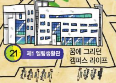
21 제1 엘림생활관 꿈에 그리던 캠퍼스 라이프