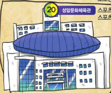
20 성암문화체육관 스포츠비즈니스학과 스포츠건강관리학과